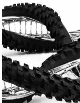
Dunlop Geomax 100/90-19 57M 720° 2X, 2013 Gepolijst en gepatineerd roestvrij staal Studio Wim Delvoye

In het werk van Wim Delvoye neemt rotatie een centrale plaats in. De Twisted Works ('verwongen werken') die in het midden van de jaren 2000 ontstaan ( Pieta Twisted , 2005), zijn zowel kopieën als modificaties van oude beelden, die door een draaibeweging worden vervormd. Ook de Carved Tyres (2010-2014) en Twisted Tyres (2013) resulteren uit een reflectie over rotatie en vervorming. De kunstenaar putte hiervoor zijn inspiratie uit banale objecten (in dit geval auto- en fietsbanden) die echter een krachtige symbolische en historische lading hebben (een uitvinding van de 19de eeuw die nog altijd onmisbaar is voor de momenteel meest gebruikte individuele transportmiddelen). De Carved Tyres zijn banden gesculpteerd met weelderige ornamenten die zowel affiniteiten hebben met het Oosten als met de renaissance of de art nouveau. Ze zijn volledig met de hand bewerkt, maar zo gedetailleerd dat we eerst aan machinaal precisiewerk denken en ons afvragen of het om speciale reeksen gaat van Dunlop of Pirelli. De kunstenaar voedt die verwarring volop, net zoals hij dat doet met de Twisted Tyres , maar hier in omgekeerde richting: deze assemblages van fietsbanden zijn eigenlijk complexe sculpturen in roestvrij staal die geproduceerd zijn op basis van 3D-prints. Deze werden vervolgens zorgvuldig