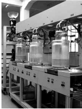
Cloaca New and Improved , 2001 Gemengde technieken Studio Wim Delvoye

met Merda d'Artista . Cloaca overstijgt echter het louter artistieke domein en omvat ook dat van de wetenschappen en techniek en zelfs de economie. De kunstenaar probeerde immers om Cloaca officieel op de beurs te laten noteren. Deze ironische benadering van de kapitalistische economie (Wim Delvoye verwijst in dit verband zelfs naar de film Modern Times van Charlie Chaplin) geldt ook voor de kunstmarkt: vacuümverpakte en authentiek verklaarde 'producten' van de machine werden verkocht op dezelfde manier als de eigen werken van Wim Delvoye. Cloaca wordt geregeld geëxposeerd in alle hoeken van de wereld en wekt altijd erg uiteenlopende reacties op, naargelang de context waarin het wordt getoond. Deze commentaren zeggen veel over zijn publiek: misschien is dat uiteindelijk wel het bestaansrecht van Cloaca .