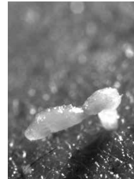
Sybille II , [1999] Video-installatie Studio Wim Delvoye

In een gouden licht trekken vertraagde beelden voorbij met zoetelijke achtergrondmuziek. Het is niet meteen duidelijk wat we zien, maar al snel krijgt de toeschouwer er een ongemakkelijk gevoel bij. Maar er is geen twijfel mogelijk: het zijn wel degelijk mee-eters die traag uit een vette huid worden geduwd, in close-up en erg hoge resolutie gefilmd. Met deze video refereert Wim Delvoye ironisch aan de etherische esthetica van de films van fotograaf David Hamilton (lang voor deze door meerdere van zijn modellen werd beschuldigd van seksuele agressie en in 2016 zelfmoord pleegde). Om zijn 'model' te vinden (dat in tegenstelling tot wat de titel suggereert, een jongen is) heeft de kunstenaar een nogal atypische casting georganiseerd onder jonge studenten in verschillende kunstscholen. Hij was op zoek naar een meisje of jongen die in de overgang naar volwassenheid bijzonder weinig fotogeniek was. De kunstenaar zelf is diegene die de mee-eters uitknijpt, maar hij had ongetwijfeld zonder veel problemen iemand anders gevonden om het te doen: op YouTube is Sybille II een hit tussen de video's over dermatillomanie, een stoornis waarbij compulsief aan de huid wordt gepulkt of erin geknepen om alle onzuiverheden te verwijderen.