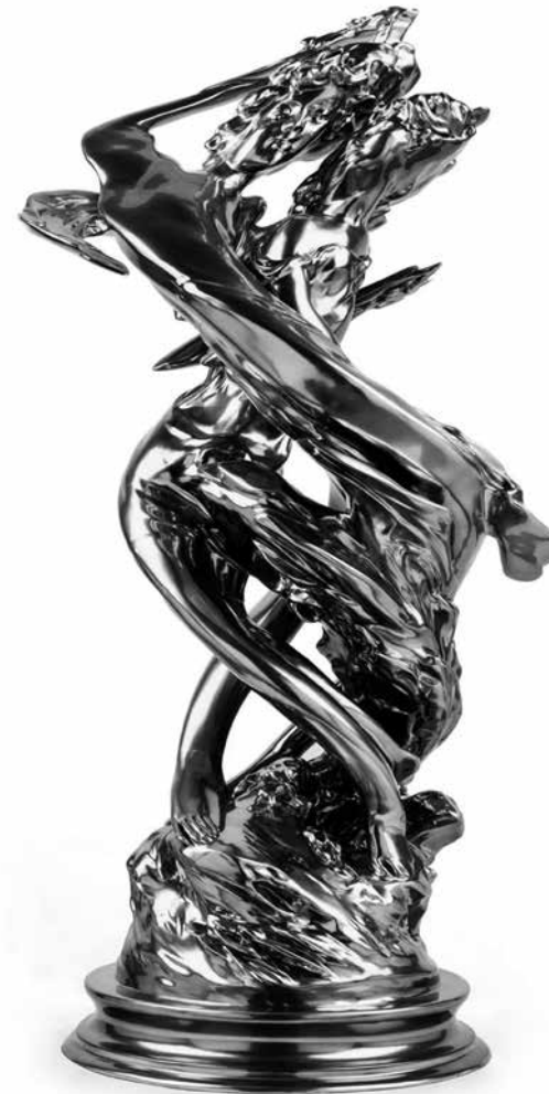
Daphnis & Chloë [Counterclockwise], 2009 Gelakt brons Studio Wim Delvoye

Speciaal voor deze expositie maakte Wim Delvoye drie Twisted Works naar twee sculpturen uit de collectie van de Koninklijke Musea voor Schone Kunsten van België: De rover van het arendsnest van Jef Lambeaux (1890-1892) en De dans van Raoul Larche (ca. 1900; in bewaring van het Brussels Hoofdstedelijk Gewest). Dit werk heeft als ondertitel Loïe Fuller , de naam van de danseres (1862-1928) die bekend werd met haar spectaculaire choreografieën waarin ze danste met golvende sluiers die door gekleurde projectoren werden belicht. In zijn interpretatie van het beeld van Larche versterkt Delvoye de beweging op twee verschillende manieren: Clockwise (in wijzerzin) en Counterclockwise (in tegenwijzerzin). De Twisted Works zijn met oude technieken gegoten, maar hun vorm is tot stand gekomen door gebruik te maken van digitale technologie het oorspronkelijke model wordt vanuit alle hoeken in hoge resolutie gescand en vervolgens wordt het beeldbestand gemodificeerd en in 3D geprint. Dit levert dan de basis voor de uitvoering van het uiteindelijke gegoten stuk.