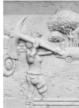
Untitled [Fortnite 01], 2018 Marmer Studio Wim Delvoye

Deze marmeren bas-reliëfs, die voor het eerst in België worden geëxposeerd, getuigen van Wim Delvoyes interesse voor de bijzonder actuele thematiek van online videogames. Deze werken ontstonden op basis van schermbeelden van wedstrijden met de games Counter-Strike en Fortnite . Ze doen denken aan archeologische objecten als stèles met afbeeldingen van gevechten die in de oudheid ter ere van krijgers werden opgericht. Vooral in de reeks Counter-Strike , waarvan de actie zich afspeelt in het Midden-Oosten, gaat het nochtans om hedendaagse conflicten. Verschillende elementen van het decor verwijzen naar trieste oorlogsbeelden die sinds decennia geregeld in het wereldnieuws opduiken.