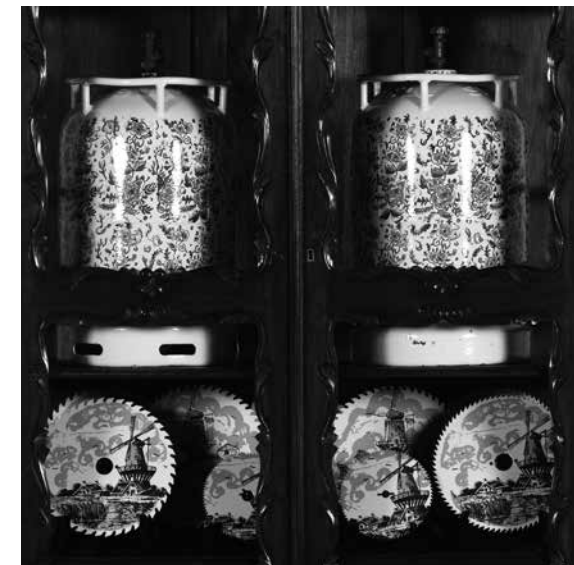
Cabinet, 1990 Vitrinekast in hout en beschilderde metalen voorwerpen (2 gasflessen en 29 zaagbladen) KMSKB, Brussel, inv. 11375

Voor deze installatie gebruikte de kunstenaar een vitrinekast in Hollandse stijl die hij liet fabriceren in een atelier in Java dat gespecialiseerd is in het kopiëren van Europese meubelen. Zo verwijst de kunstenaar naar de geschiedenis van het eiland en de Nederlandse kolonisatie. Tegelijk laat hij zien hoe de ambachtshuizen hun eigen culturele referenties bestendigen in de interpretatie van decoratieve elementen (de gesculpteerde motieven lijken meer op lotusbloemen dan op rozen).