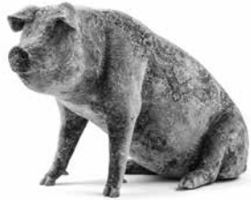
Arak, 2013 Zijden tapijt op polyester mal Studio Wim Delvoye

Wim Delvoye is een kunstenaar die in zijn werk vaak tegengestelden met elkaar verenigt. Hij houdt van varkens die geliefd zijn omdat ze overvloed symboliseren maar tevens veracht als belichaming van smerigheid. Op het einde van de jaren '90 tatoeëerde hij gelooid varkenshuiden die hij vervolgens inlijstte en als schilderijen exposeerde. Hij tatoeëerde ook levende varkens (die verdoofd werden), een artistieke praktijk die hij tussen 2003 en 2010 in een boerderij in de buurt van Peking verder ontwikkelde (zie het project Art Farm China in deze tentoonstelling).