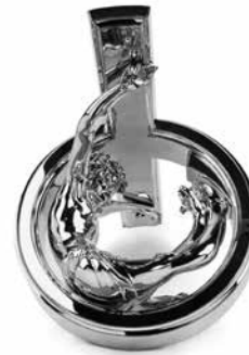
Ring Corpus Inside, 2011 Gepolijst brons

Deze reeks is voor Wim Delvoye tegelijk ook de gelegenheid om de relaties tussen kunst, wetenschap en religie te onderzoeken. Dual Möbius Quad Corpus is een complex werk waarin twee kruisen zo in elkaar passen dat ze een Möbiusband vormen, waardoor twee symbolen voor het