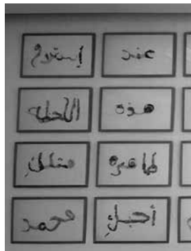
Love Letter I, 1998 – 1999 36 Cibachrome prints achter plexi Brussels Hoofdstedelijk Parlement

Love Letter I is onderdeel van een reeks van zeven composities gebaseerd op hetzelfde principe: foto's van aardappelschillen tegen een witte achtergrond samengebracht in reeksen van verschillende omvang [zo telt Love Letter V slechts achttien foto's, terwijl de hier geëxposeerde reeks er zesendertig telt]. Deze variaties spruiten voort uit de essentie van de werken. Het zijn immers liefdesbrieven van verschillende lengte, die een zekere Mohammed aan een zekere Caroline schrijft. De schillen zijn zo neergelegd dat ze woorden vormen in het klassieke Arabisch. Elk ensemble vormt het fragment van een in zeven tableaux verteld liefdesverhaal, van de aanvankelijke passionele liefde tot de droefheid van de breuk.