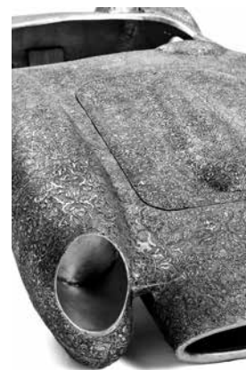
Untitled [Ferrari Testa Rossa], 2017 Gehamerd aluminium Studio Wim Delvoye

Met zijn 420 paarden was de Maserati 450s de krachtigste sportauto van zijn tijd. Er werden tussen 1956 en 1958 maar tien exemplaren van gemaakt. De Testa Rossa van Ferrari, die in dezelfde periode werd geproduceerd, is onder liefhebbers een echt icoon geworden. Voor deze werken heeft Wim Delvoye zich dus gewaagd aan legendes van de autowereld. Het zijn natuurlijk geen originelen. De Maserati is een replica op ware grootte en de Ferrari een kopie op kleinere schaal. De 450s werd van in het begin uitgebracht met een carrosserie in aluminium, een materiaal dat gemakkelijk in reliëf kan worden bewerkt door drijven of gaufren. De motieven zijn ontleend aan het ornamentale repertoire van de islamitische kunst en werden op de auto's aangebracht door Iranese ambachtslui. De geometrische en florale vormen zijn aangevuld met kalligrafische elementen, zoals 'Isra en Miraj' op de motorkap van de Maserati, die verwijzen naar twee episodes uit het leven van de profeet Mohammed. De kunstenaar nodigt ons dus uit voor een ontmoeting tussen het Oosten en het Westen, maar ook tussen technologie en ambacht.