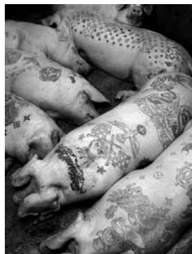
Art Farm, 2005 Video-installatie, 3 schermen Studio Wim Delvoye

speciaal voor deze tentoonstelling gerealiseerde twisted versie van De rover van het arendsnest van Jef Lambeaux), wil Delvoye het met zijn Rorschach -werken integendeel via symmetrie een vorm van stabiliteit opleggen.