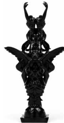
L'Étincelle Divine Rorschach , 2012 Gepatineerd brons Studio Wim Delvoye

De 'Rorschach'-test werd in 1921 bedacht door de psychoanalyticus Hermann Rorschach. Bij de test wordt een reeks platen met symmetrische vormen getoond die door de patiënt vrij geïnterpreteerd moeten worden. Deze persoonlijkheidstest is bij een ruim publiek bekend en wordt vaak gebruikt in de populaire cultuur, vooral in Hollywoodfilms ( Armageddon , The Silence of the Lambs , Batman Forever... ). De test inspireerde ook tal van kunstenaars (zoals Andy Warhol die in de jaren 1980 hieraan een hele reeks wijdde), maar Wim Delvoye is een van de weinigen die hem als sculptuur benadert. Zijn Rorschach -reeks ligt in de lijn van de Twisted Works , waarvoor hij vertrekt van een kopie van een sculptuur, meestal uit de 19de eeuw, die hij dan radicaal transformeert om een nieuw werk te produceren. Maar terwijl de Twisted Works de beweging die al in het model aanwezig is tot in het buitensporige versterken (zie onder meer de