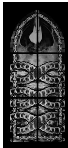
Monday, 2013 Staal, geëst glas, lood Studio Wim Delvoye

De gebrandschilderde ramen van de reeks Days of the Week (De dagen van de week) zijn een mooi voorbeeld van de manier waarop Wim Delvoye zijn interesse voor technologie combineert met zijn voorliefde voor artistieke vormen uit het verleden. Ze sluiten aan bij zijn experimenten rond gotische architectuur en ornamenten (voor het Mudam van Luxemburg ontwierp hij in deze stijl een echte kapel in Corten-staal), maar voor de productie maakte hij gebruik van verschillende gesofisticeerde technieken voor medische beeldvorming. Zoals een portrettist die zijn modellen uitnodigt in zijn atelier, vroeg hij zijn modellen om een hele week elke dag met hem mee te gaan naar een radiologisch kabinet, waar hij met verschillende apparaten experimenteerde om letterlijk hun binnenkant weer te geven.