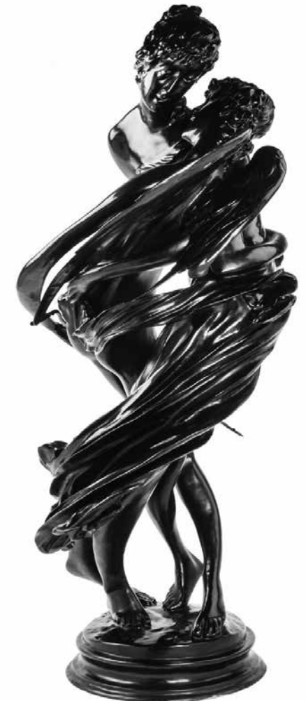
> Le Secret , 2018 Gepatineerd brons Studio Wim Delvoye