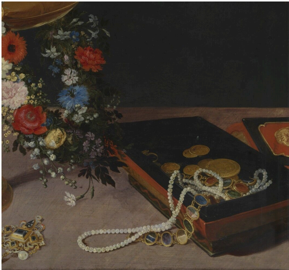
Jan I Brueghel, dit Brueghel de Velours, 'Nature morte avec guirlande de fleurs et coupe', 1618?